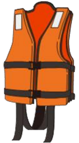
ライフジャケット